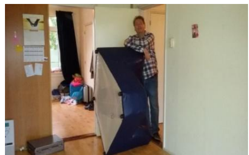
van Heerenveen naar Suriname