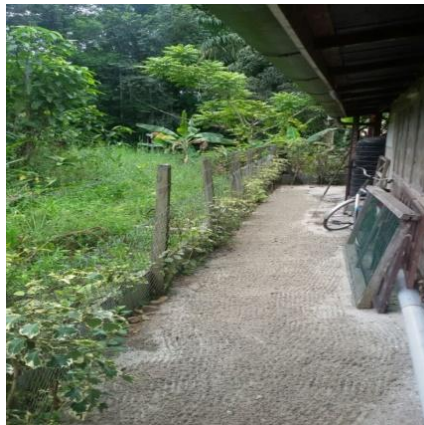
oerbos achter huis