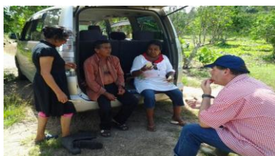
op de citrusplantage

We hebben in Saramacca een kerkdienst bijgewoond van een hindoestaanse familie nadat we voor hun citrusplantage hadden gebeden. De vrouw is een gelovige vrouw en haar man niet. Ze vertelden ons over de mierenplaag op hun perceel. In de nachtelijke uren kwamen enorme mieren uit de grond en vraten de jonge blaadjes van de bomen op. Toen we dit hoorden zijn we samen met deze familie gaan bidden en hebben deze mierenplaag bestraft. In de periode daarna bleven de mieren weg en de oogst was uitzonderlijk groot. Dit heeft de man, onze vriend nu, zo verbaast dat hij de hand van God hierin herkende. Hij ruimde de afgodenbeelden op en alles wat met afgoderij te maken heeft. Eind december wordt hij 65 jaar en wilde een christelijke dankdienst thuis houden. Dit is een hele vooruitgang en we bidden dat hij een bijzondere ontmoeting met Jezus mag hebben.