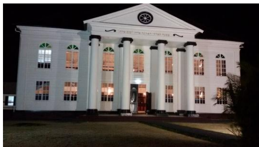
synagoge uit 1718